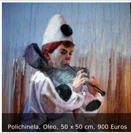
Polichinela, Oleo, 50 x 50 cm, 900 Euros